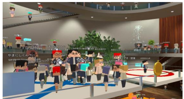
アバターバーチャル体験