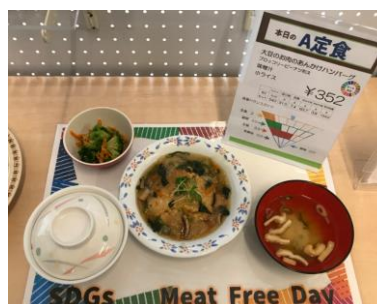
ミート0の日のメニュー