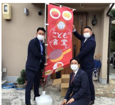
全国各地の子ども食堂へ