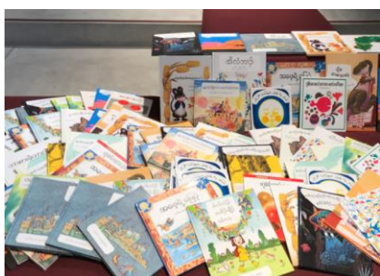
現地の言葉に翻訳したシールを貼った絵本